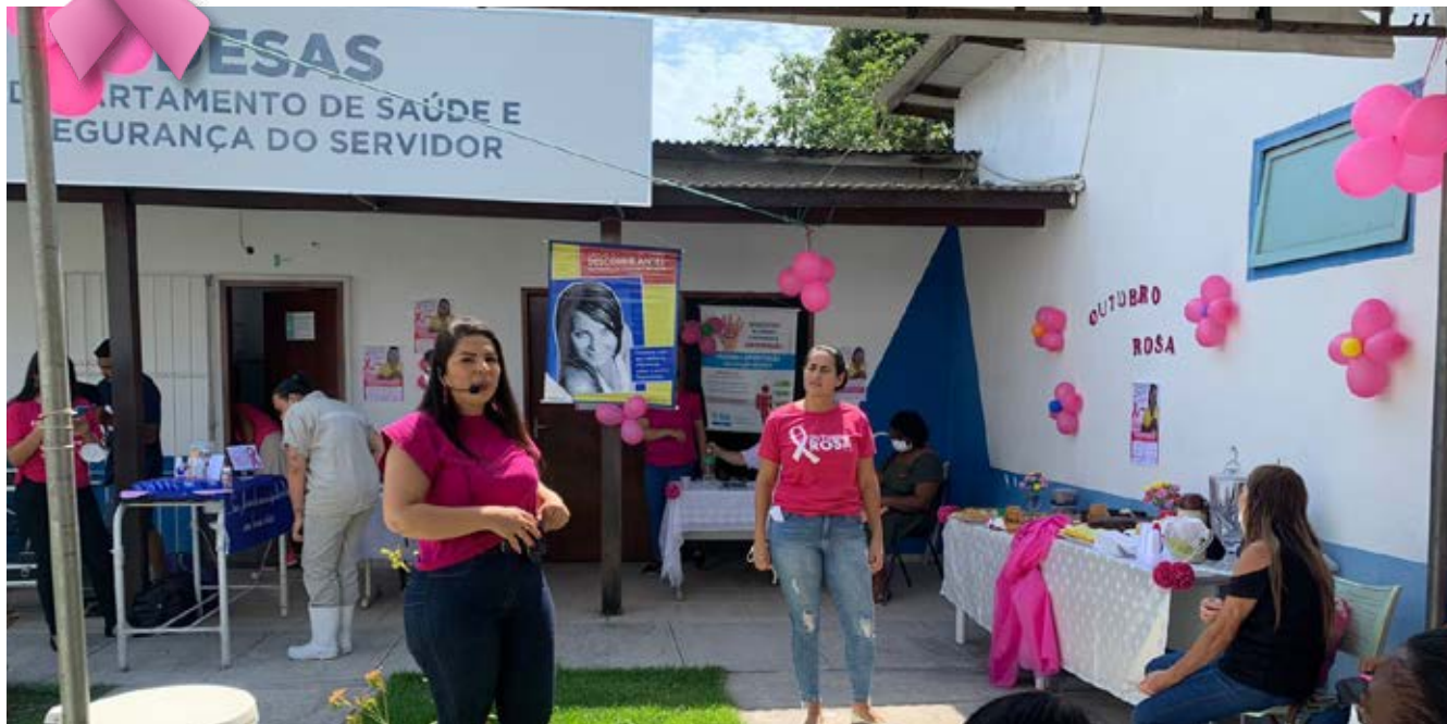
Unidades estão promovendo atividades educativas voltadas para Saúde da Mulher

A programação da campanha Outubro Rosa segue diversificada em Rio das Ostras e o Dia D já está marcado para o próximo sábado, 22 de outubro, com atividades a partir de 9h. Nesta quinta, 20, tem caminhada na Praia da Tartaruga e na sexta, 21, Dia da Beleza, na Praça José Pereira Câmara, no Centro.