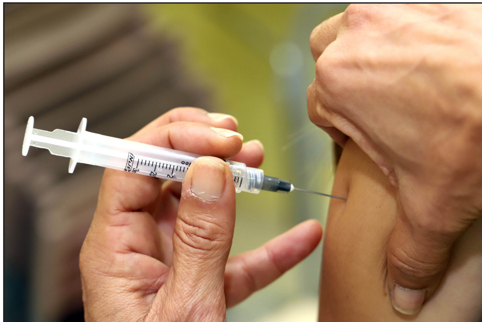
Grupos prioritários devem procurar as unidades vacinadoras de Rio das Ostras de 13h às 16h

Em Rio das Ostras, a Campanha de Vacinação começou no dia 4 de abril, e foram divididas em duas etapas, conforme a orientação do Ministério da Saúde, por meio de Nota Técnica. O governo federal tem como meta vacinar 90% do público alvo contra Influenza e 95% contra sarampo.