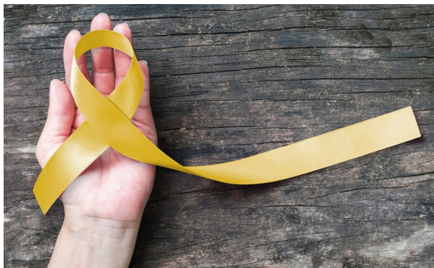
A campanha tem o objetivo de alertar sobre a importância da prevenção, realização dos testes e de tratamento adequado

Na maioria das vezes, são infecções silenciosas, ou seja, não apresentam sintomas. Entretanto, quando presentes, elas podem se manifestar como: cansaço, febre, mal-estar, tontura, enjojo, vômitos,