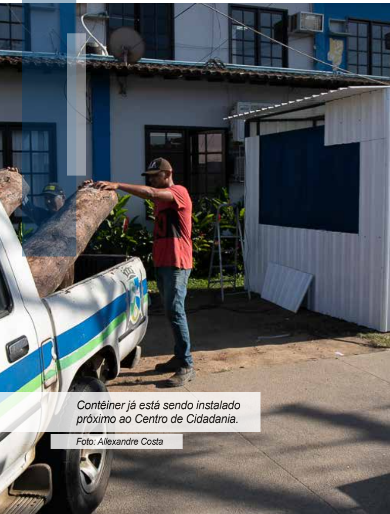
Contêiner já está sendo instalado próximo ao Centro de Cidadania.

Para receber a refeição não é preciso fazer um cadastro prévio, somente se dirigir ao Centro de Cidadania . Serão distribuídos 500 kits de café da manhã.