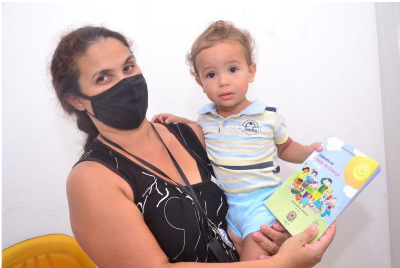
Crianças entre 1 e 5 anos incompletos serão imunizadas contra Polio Adolescentes também são público da Campanha de Multivacinação.