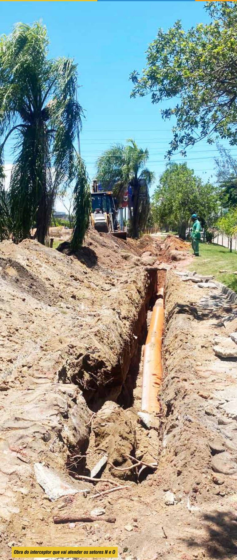
Obra do interceptor que vai atender os setores N e O

Ed n.º 1953 - Quarta-Feira - 29 de Abril de 2026